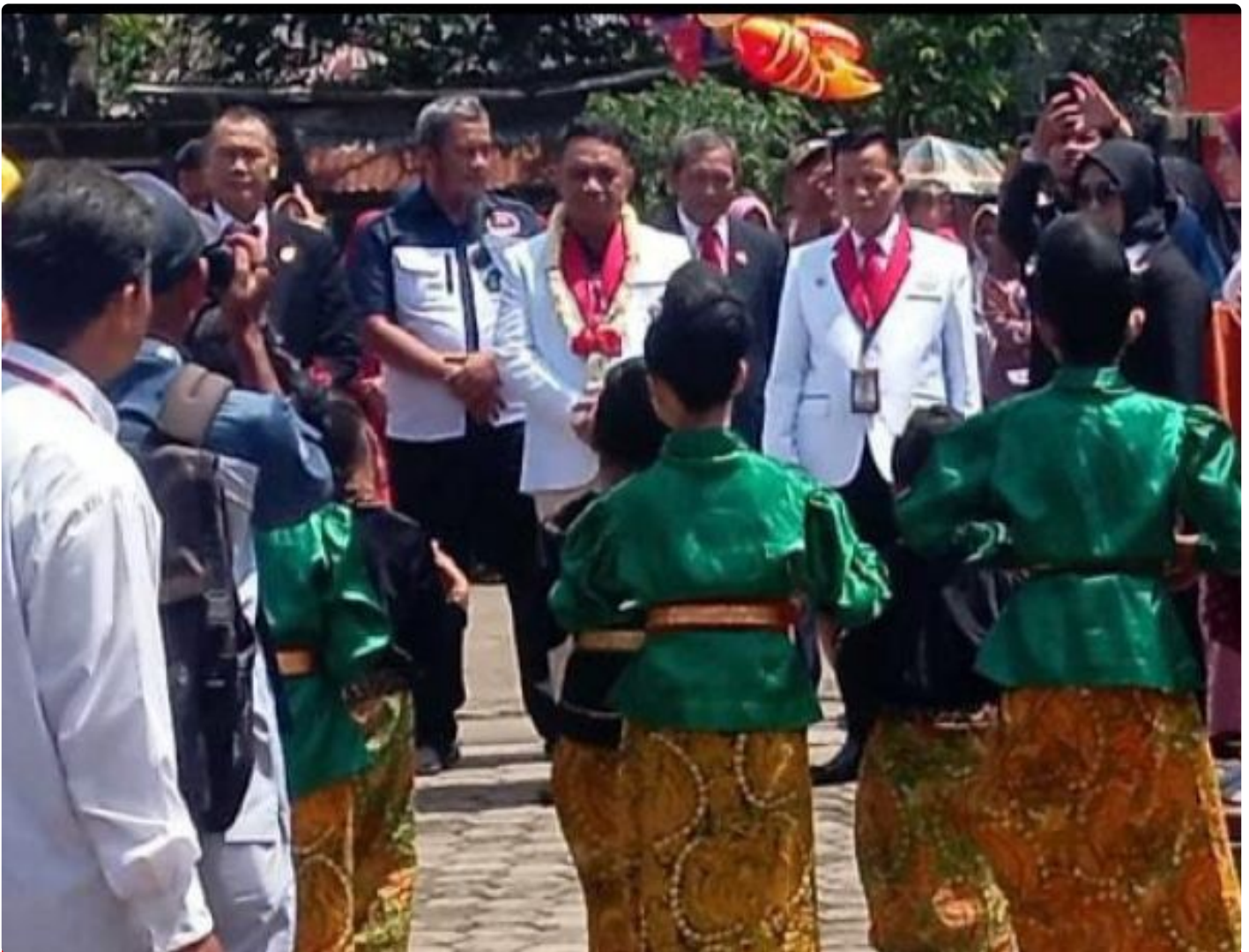
BKNDI Jateng Pantau Program Makan Bergizi Gratis di SD Negeri 02 Bantarsari

CILACAP - Badan Komunikasi Nasional Desa se-Indonesia (BKNDI) kembali menggelar program pendistribusian makanan bergizi tahap VI, VII, dan VIII di Cilacap, Jawa Tengah. Adapun Program Makan Bergizi Berlangsung di Sekolah Dasar (SD) Negeri 02 Bantarsari, Kecamatan Bantarsari, Kabupaten Cilacap, pada Kamis Pagi (20/02/2025) mulai pukul 09.00 WIB.